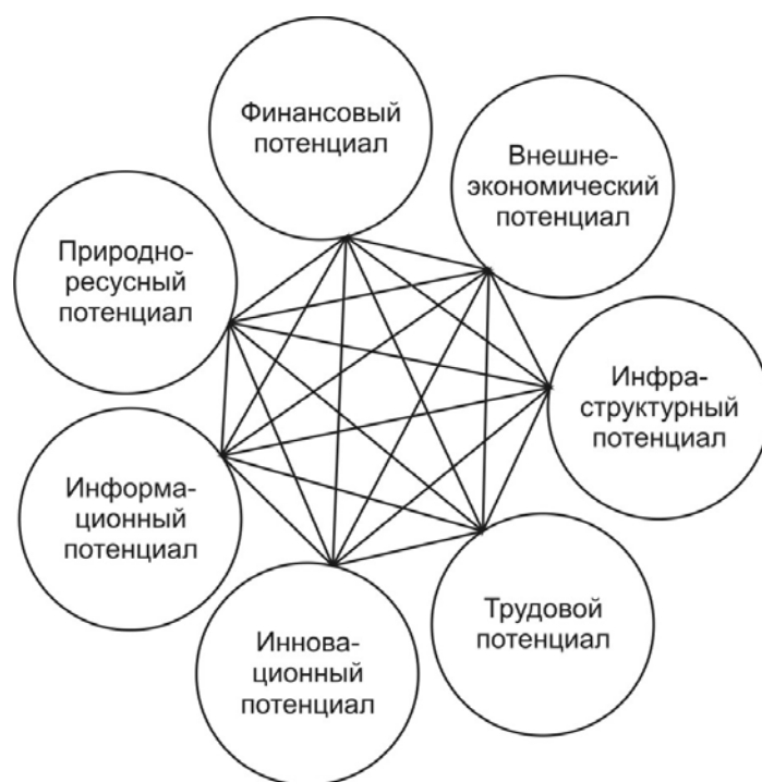
Рис. 1. Составные элементы ресурсной составляющей экономического потенциала региона

Элементами ресурсной составляющей экономического потенциала являются природно-ресурсный потенциал, финансовый потенциал и инвестиции в регион, информационные ресурсы и инновационный потенциал, трудовой потенциал региона и инфраструктура, а также внешнеэкономический потенциал. Элементом результативной составляющей экономического потенциала является способность экономики региона обеспечивать устойчиво высокий уровень ее конкурентоспособности за счет эффективного использования экономического потенциала. Внешнеэкономический потенциал региона – это совокупность возможностей для производства товаров и услуг, ориентированных на внешний рынок в целях сбалансированного социально-экономического развития; обеспечения участия региона в международ-