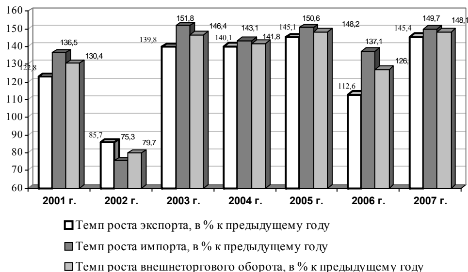
Рис. 3. Динамика основных показателей внешней торговли Белгородской области в 2001–2007 гг. (в процентах к предыдущему периоду)

Анализ экономики Белгородской области за последние годы показывает, что сохраняется устойчивая тенденция роста показателей, характеризующих развитие основных отраслей экономики. Динамика основных показателей внешней торговли Белгородской области в 2001–2007 гг. показана на рис. 3.