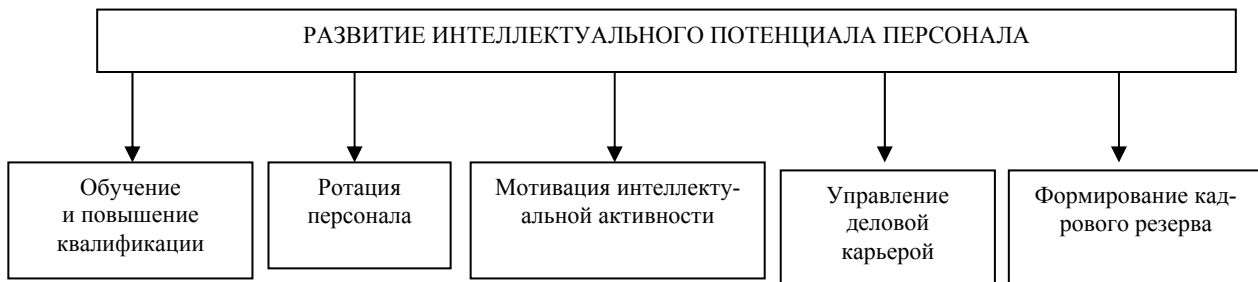
Рис. 1. Элементы развития интеллектуального потенциала персонала

Интеллектуальный потенциал персонала лежит в основе эффективной работы любой организации и является источником роста производительности труда. Развитие интеллектуального потенциала персонала представляет собой систему взаимосвязанных действий, основными элементами которой являются обучение, управление деловой карьерой, формирование кадрового резерва, ротация персонала и мотивация интеллектуальной активности (рис. 1).