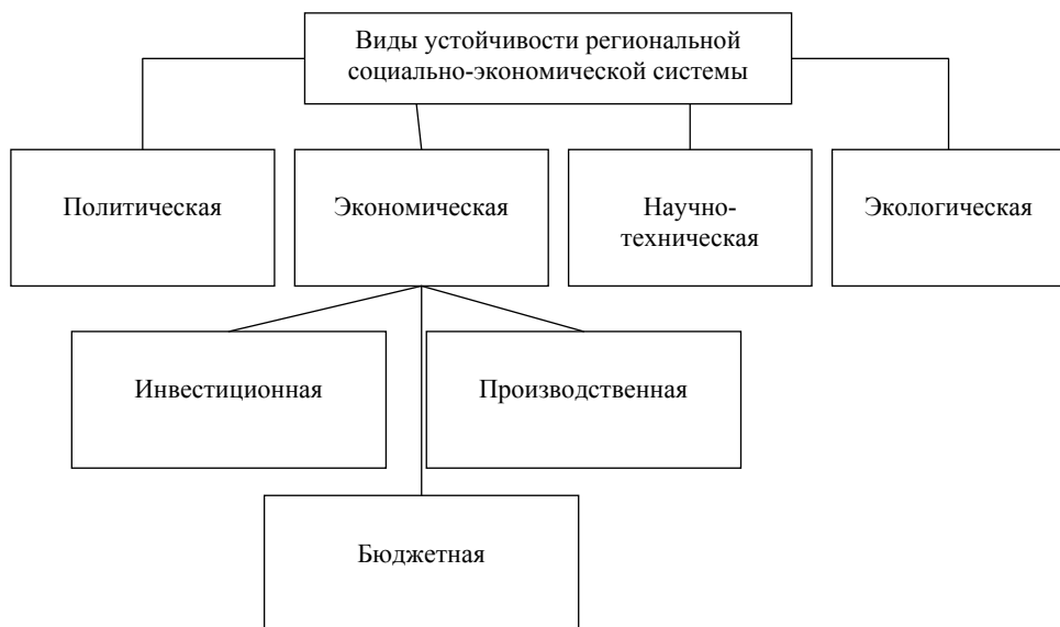
Рис. 2. Виды устойчивости региональной социально-экономической системы.

Разработка и применение таких инструментов основаны на целостно-ориентированном, нормативно-правовом и системно-управленческом подходах. Основными требованиями к формированию инструментария управления являются реалистичность, обоснованность и реальность предложений. Комплекс мероприятий должен быть системным, т.е. должен основываться на ценностном выборе, анализе действующих на определенный момент времени мер по реализации бюджетной и налоговой политики, определении основных факторов и проблем, препятствующих достижению поставленных целей, на определенном наборе инструментов, решений и действий.