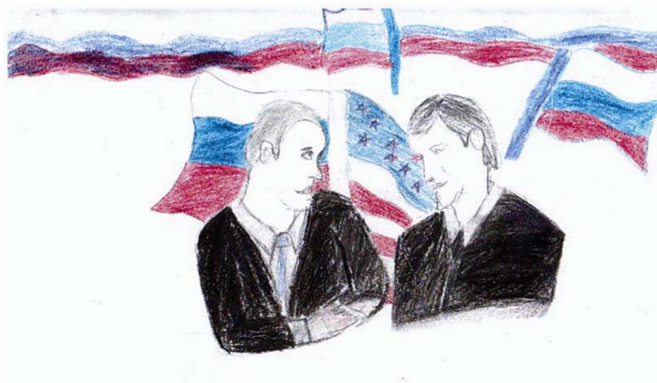
Рис. 9. Тандем

дерального уровня встречаются Владимир Путин, Дмитрий Медведев (с 2008 г.) (рис. 9), Владимир Жириновский, Геннадий Зюганов, Григорий Явлинский; региональных политиков «представляет» Александр Ткачев, политиков муниципального уровня – Владимир Евланов (мэр Краснодара); лидеров зарубежных стран – Джордж Буш, Усама Бен Ладен, Александр Лукашенко. Очевидно, что рисунки с изображением действующих президентов или кандидатов на их пост в период предвыборных кампаний («головы» политической системы) отражают массовые стереотипы и ожидания взрослых. Как правило, это положительные образы. В то же время в этом сегменте политической картины мира российских детей отсутствуют ретроориентации. Если американские дети в качестве персон, олицетворяющих политику, также изображают «отцов-основателей» (Джорджа Вашингтона, Авраама Линкольна), то в более чем пятистах российских рисунках нет ни одного исторического персонажа. Однако палитра реальных политических персон в российских рисунках гораздо богаче и далеко выходит за рамки президентской власти, демонстрируя тенденцию своеобразной «децентрализации» власти, то есть понимание того, что, кроме президента, во власти есть и другие властные фигуры, среди которых он (президент) все же наиболее важный. Обращает на себя внимание тот факт, что на рисунках представлены только те персоны, которые представляют государство, или политические лидеры, уже кооптированные в государственные структуры.