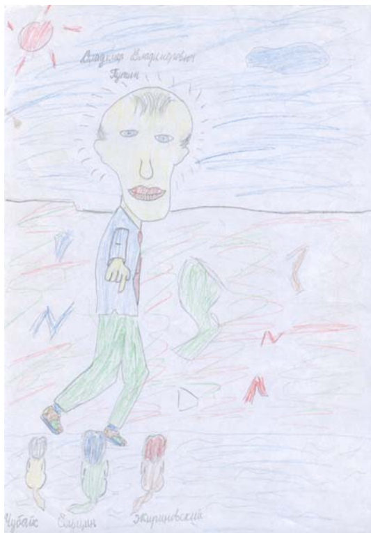
Рис. 10. Дрессировщик

Анализ рисунков позволяет сделать вывод о том, что в политической картине мира представлено субъект-объектное взаимодействие власти и общества, субъектом этих отношений выступает власть. Этот вывод подтверждается, во-первых,