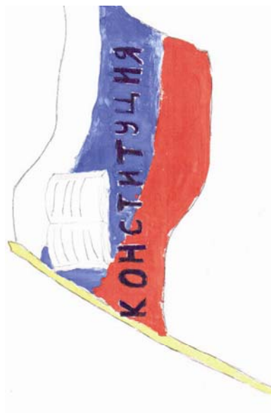
Рис. 1. Флаг

В политической картине мира детей базисные концепты политической системы отражены символично. В первую очередь, это национальная символика, изображения государственного флага (рис. 1) и герба страны (рис. 2). Отметим, что символизм – сущностная черта детской картины мира. В рисунках американских детей национально-государственные и партийные символы также встречаются довольно часто. Использование в рисунках национально-государственной символики, на наш взгляд, говорит о том, что дети знакомы с символами государственной власти (рис. 3) и в большинстве случаев могут их верно воспроизводить. Высокая частота повторений, упоминаний символов позволяет сделать вывод о том, что они являются знакомым и значимым сюжетом в картине мира ребенка.