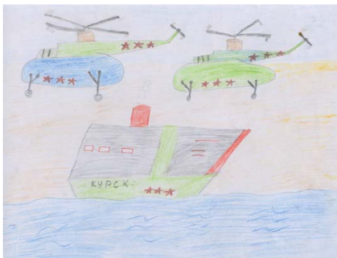
Рис. 11. Курск

В детских рисунках мы наблюдаем также актуализацию событий регионального или муниципального уровней. Их всех объединяет сильная эмоциональная (позитивная или негативная) доминанта в повестке дня. Например, гибель подводной лодки «Курск» (рис. 11), пожар в доме престарелых, победа Сочи как столицы Олимпийских игр 2014 г. (рис. 12), объединение муниципальных образований.