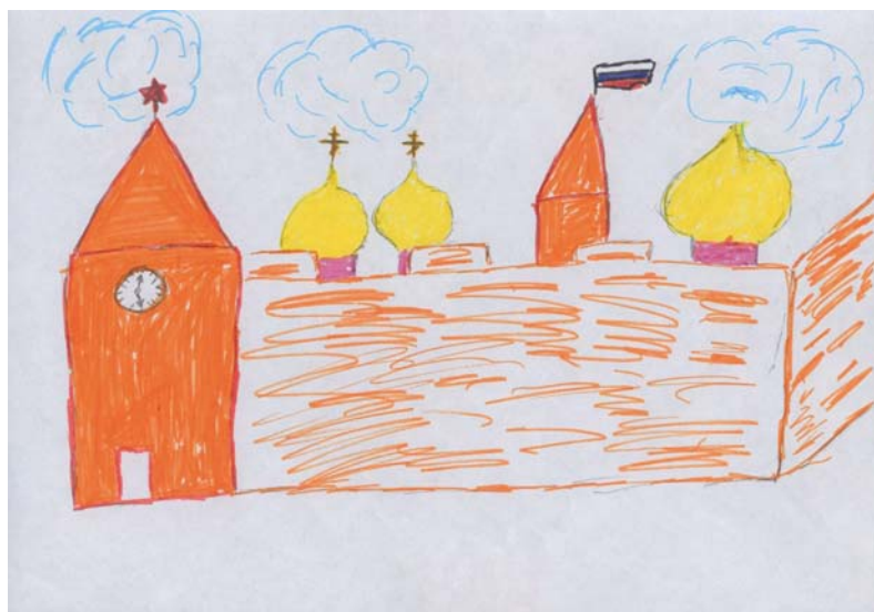
Рис. 6. Кремль

Тенденцией последнего десятилетия стало появление наряду с национальной символикой символики региональной и локальной. Например, дети в Краснодарском крае рисуют флаг и герб Кубани. В последние два года дети стали изображать и символику муниципальных образований (например, герб города Краснодара). Постепенно выстраивается вертикаль глобальное – национальное – региональное – муниципальное. Демонстрация локальной и региональной идентичности происходит через персоналии и символы