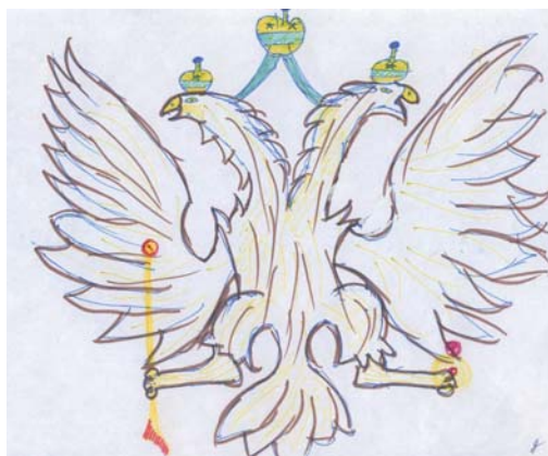
Рис. 2. Герб