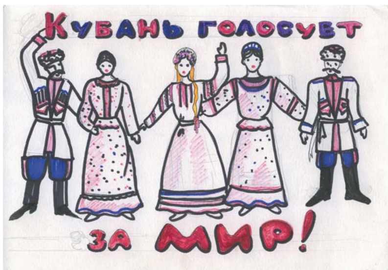
Рис. 5. Кубань за мир