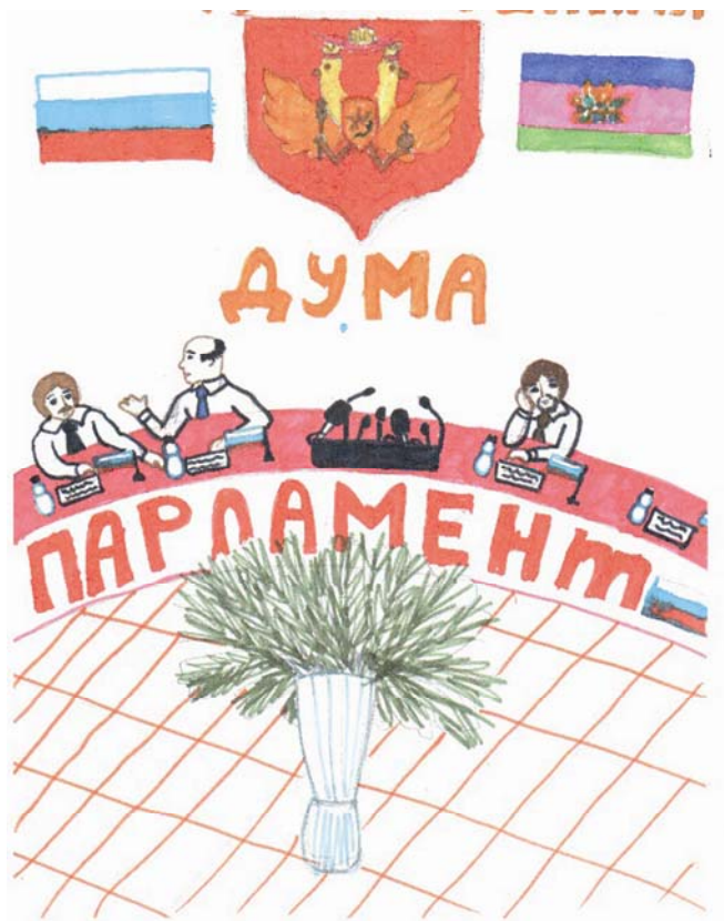
Рис. 3. Дума