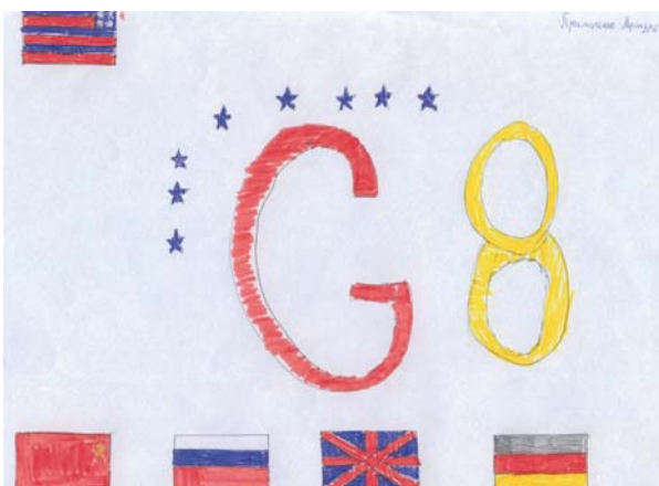
Рис. 14. Восьмерка

Поведение человека в политике определяется образом Я в политической картине мира. В младшем школьном возрасте этот образ только начинает формироваться. Он заметен в гендерных проекциях (женщина-президент на рисунке девочки) или (чаще всего) в типичном для ребенка этого возраста эгоцентричном взгляде на политику как часть окружающего мира (что такое политика? – это я (мой дом, моя школа, место работы моих родителей) с российским флагом!)