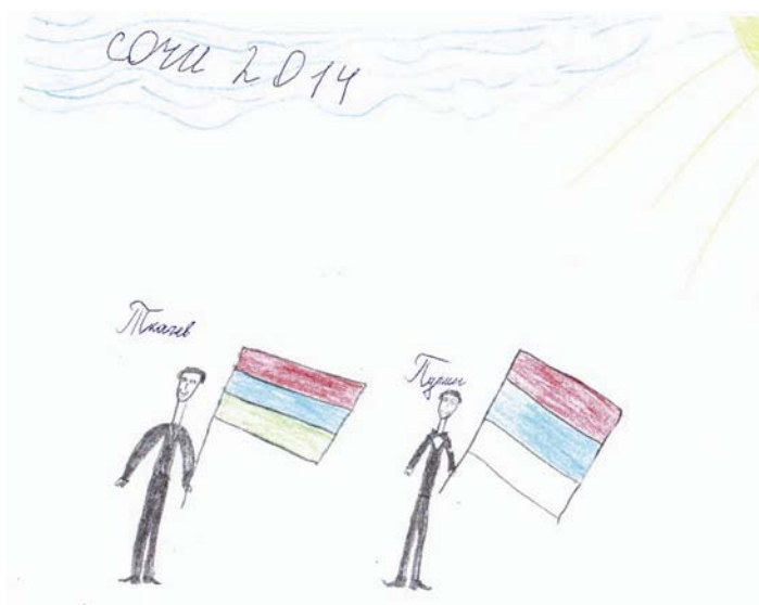
Рис. 12. Сочи