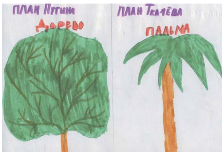
Рис. 4. План Путина. План Ткачева