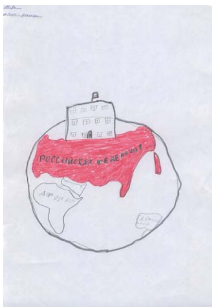
Рис. 13. Карта

Часть рисунков позволяет также говорить о начале формирования геополитической компоненты политической картины мира, то есть представлений