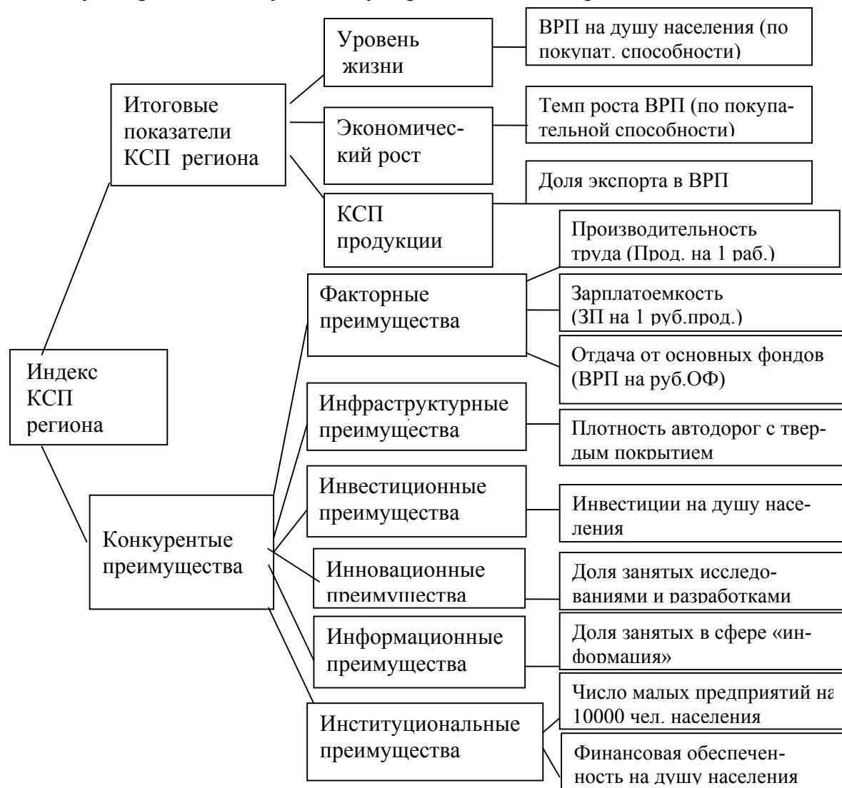
Рис.2. Схема агрегирования показателей в индекс КСП регионов

Целостная картина организации индекса КСП регионов, отвечающего проделанному теоретическому анализу, представлена на рис. 2.