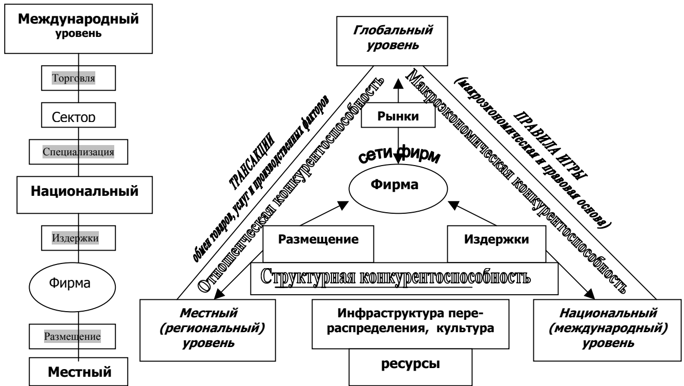
Рис.1. Реструктуризация мировой конкурентной среды

В современных условиях региональное развитие является результатом сочетания глобальных и локальных процессов, которые указаны в табл.3.