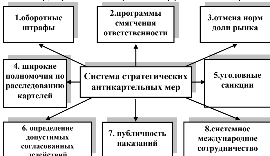
Рисунок 2 - Современная система стратегических антикартельных мер

Изменяется тактика антиконкурентного поведения хозяйствующих субъектов, которым становится выгоднее действовать в рамках латентных структур вместо «прозрачной» монополизации рынка. Особенность процессов картelizации на современном этапе заключается в долгосрочном негативном «мульти-эффекте» – «эффект широкого фронта» или «эффект партизанской войны» носит комплексный характер: повышается выгода ограничивающих конкуренцию соглашений и согласованных действиях для субъектов-участников; и изменяется рыночная конъюнктура согласно вектору, задаваемому картельными структурами, а не рыночными механизмами. В исследовании автором представлена комплексная система стратегических антикартельных мер, строящаяся на принципе эффективного сдерживания (рис. 2).