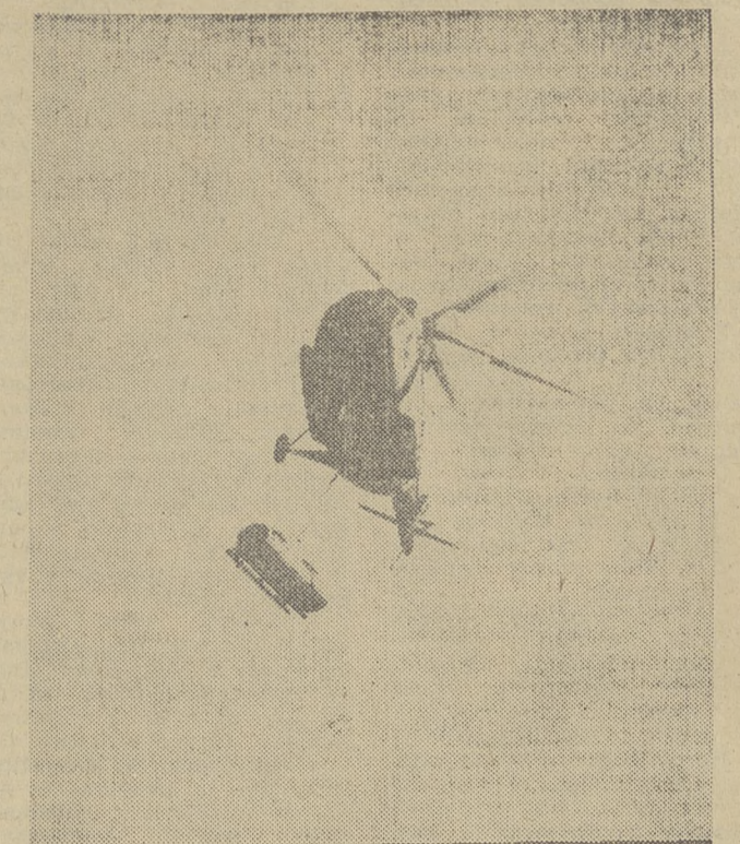
Стопадр. «ВОЗДУШНЫЙ ИЗВОЗЧИК».

Под занавес тура Псахис победил Ллугана, вничью сыграли Чехов и Кузмин. Шесть партий отложены.