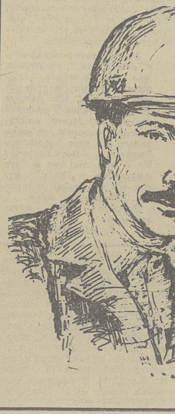
Рисунок М. Нестерова.