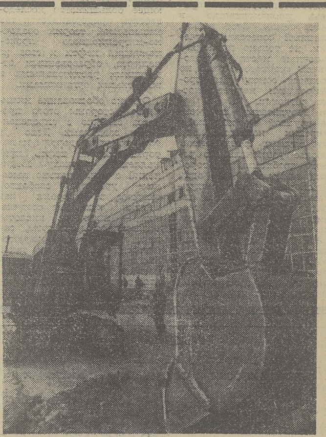
НРБ. Сталинский завод близ Шинниамы, пуск первой очереди которого намечен на конец этого года. — пример социалистической интеграции в действие. В его строительстве активное участие принимают специалисты братских стран — Советского Союза, Польши, ГДР, Чехословакии.

Почти каждый 14-й трудоспособный житель страны не имеет работы. Армия безработных уже сейчас составляет почти два миллиона человек и, по прогнозам экспертов, этой цифрой вырастет до 2,5 миллиона.