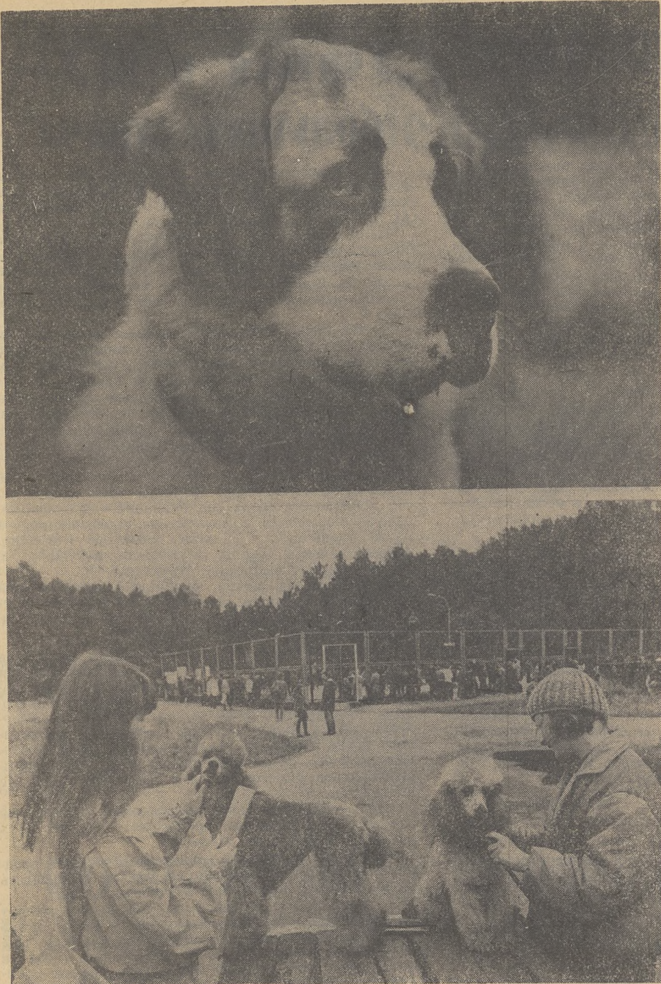
ЗАРИСОВКИ С НАТУРЫ