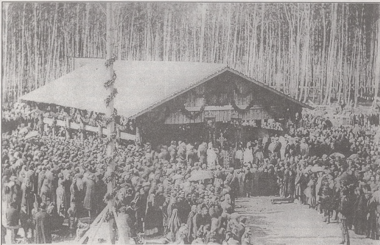
Закладка Императорского Томского университета 26 августа 1880 года.