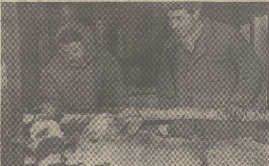
Фото В. Зыбарева. Троицкое управление.

Хорошо работают Анастасия с Виктором. Не зря говорят в народе: «Вдвоем любое дело вести легче».