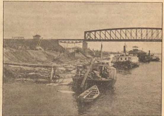
Пристань въ пос. Ново-Николаевскомъ.

такое счастье? Около десяти часовъ вечера онъ почувствовалъ себя на столько хорошо, что не только смѣялся и пѣлъ, но захотѣлъ непременно встать и идти гулять — дышать лѣтнимъ воздухомъ и грѣться на солнцѣ... Пришлось силою удерживать его въ постели, пока обезсиленный борьбой, онъ не впалъ въ безсознательное состояние.