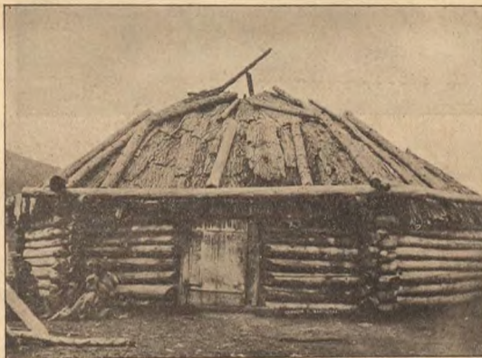
Юрта оубдлага алтайца.