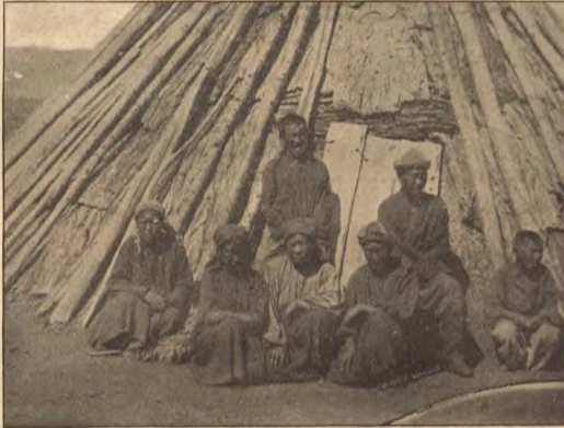
Алтайцы у своего жилища.

Въ настоящей статьѣ мы скажемъ нѣсколько словъ только о кабалѣ алтайцевъ, занимающихъ южную часть Томской губерніи—Алтайскія горы съ ихъ долинами. Уже болѣе столѣтія возникло въ этихъ мѣстахъ селеніе Уймюнокое и вскорѣ же послѣ его возникновенія является въ немъ семейство Ошлыковыхъ, которые начали вести съ алтайцами торговлю,