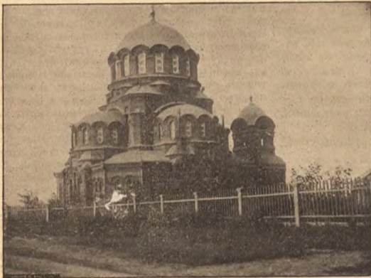
Соборъ въ пос. Ново-Николаевскомъ.

Взглянувъ также въ окно ея жизни, студентъ увидѣлъ дѣльную шеренгу людей различныхъ положеній и возрастовъ, сидящихъ, лежащихъ на тротуарахъ, на снѣгу, подъ заборомъ, на ступенькахъ, и всѣ эти люди ѣли сельди съ хлѣбомъ, а надъ каждымъ изъ нихъ была изображена картина: одинъ хотѣлъ лишиться себя жизни отъ голода, но своевременная помощь еврейки вернула ему жизнь. Другой намѣревался украсть, но та же помощь удержала его отъ преступленія. Нѣкоторые рѣшились оставить дѣтей или убить кого нибудь изъ-за денегъ, но, небольшая сельда и кусокъ хлѣба не допустили ихъ сойти съ пути. Словомъ, въ окнѣ старой еврейки можно было увидѣть массу людей несчастныхъ, озлобленныхъ, отчаивающихся, но получившихъ затѣмъ утѣшеніе, поддержку и надежду. Всѣ они