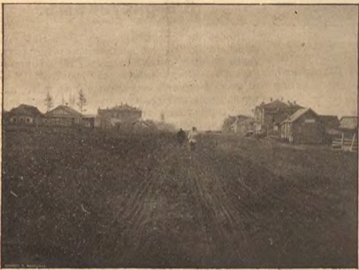
Часть соборной площади въ пос. Ново-Николаевскомъ.