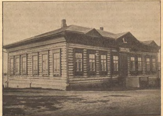
Мужское церк.-приходское училище въ п. Ново-Николаевскомъ.