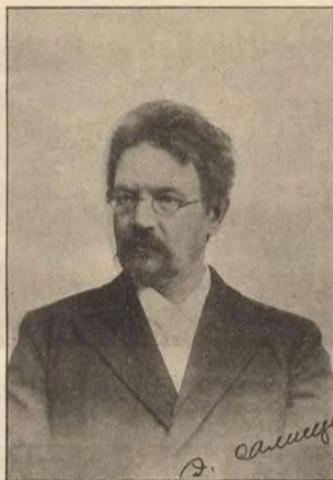
Профессоръ Э. Г. Салищевъ.

Подобно многимъ другимъ золотопромышленникамъ той ранней поры, Гороховъ не оставилъ никакой памяти въ исторіи просвѣщенія въ Сибири. Какъ это ни странно, купецъ Поповъ оставилъ въ этомъ отношеніи болѣе слѣдовъ, чѣмъ чиновникъ Гороховъ; Поповъ завѣщалъ городу капиталъ, на проценты съ котораго по