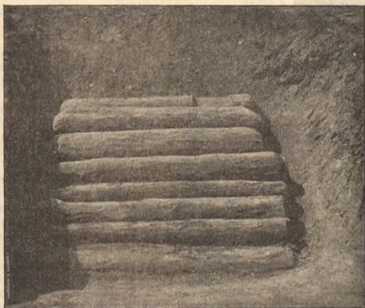
Верхъ могилы, закрытой бревешками.