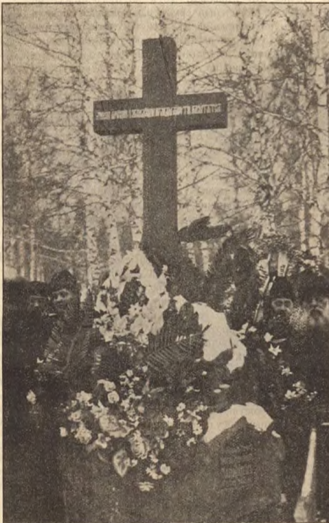
Памятник на могиле Э. Г. Салищева.

Для Сибири подобного материала относительно могильников совсем нет в литературе. Основываясь лишь на материал, добытый мною раскопками нескольких лет на площади Минусинского уезда Енисейской губ., я могу сказать, что, удерживая при этом археологами деление древних погребений на два типа, я могу признать за этим делением только вышнее значение и может быть временное, пока у