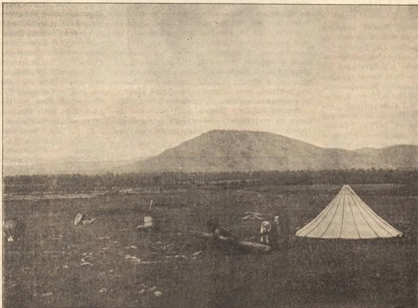
Общій видъ Курганной стѣны у Саргова улуса.