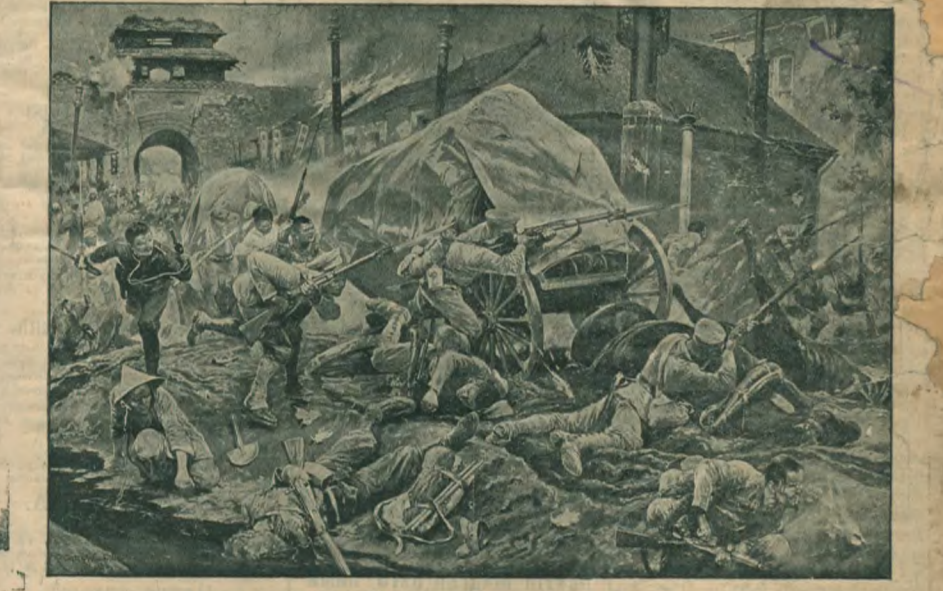
Къ бою на р. Шахе. Взятіе льнонами деревни Линшингу.

Малороссійскій спектакль въ театрѣ при бесплатной библиотекѣ. Опера Котляревскаго "Наталка Полтавка". Начало въ 1 часть дня.