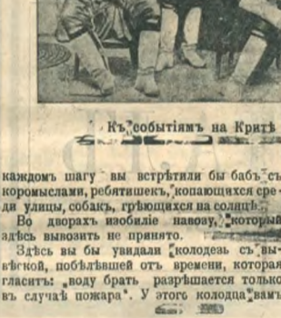
Къ событиямъ на Критъ Там критики-пожароопасней.