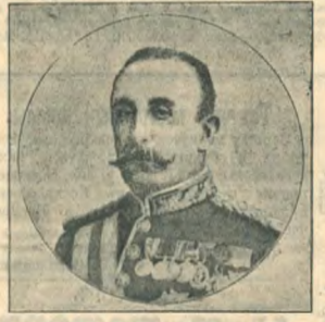
Граф Мянто, новый вице-король и генерал-губернатор Индии.