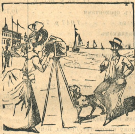
Иллюстрированный каталогъ съ самоучителемъ высылается за 30 к. марками. (10) 1.

Книги и ноты, не оказавшіяся на лицо, выписываются чрезъ своихъ ком- миссіонеровъ изъ Россіи (если въ тре- бованіи не оговорено). Магазинъ при- нимаетъ подписку на всѣ газеты и журналы. Адресъ для писемъ: Иркутскъ, книжный магазинъ Гавриловича; для телеграммъ: Иркутскъ Гавриловичу.