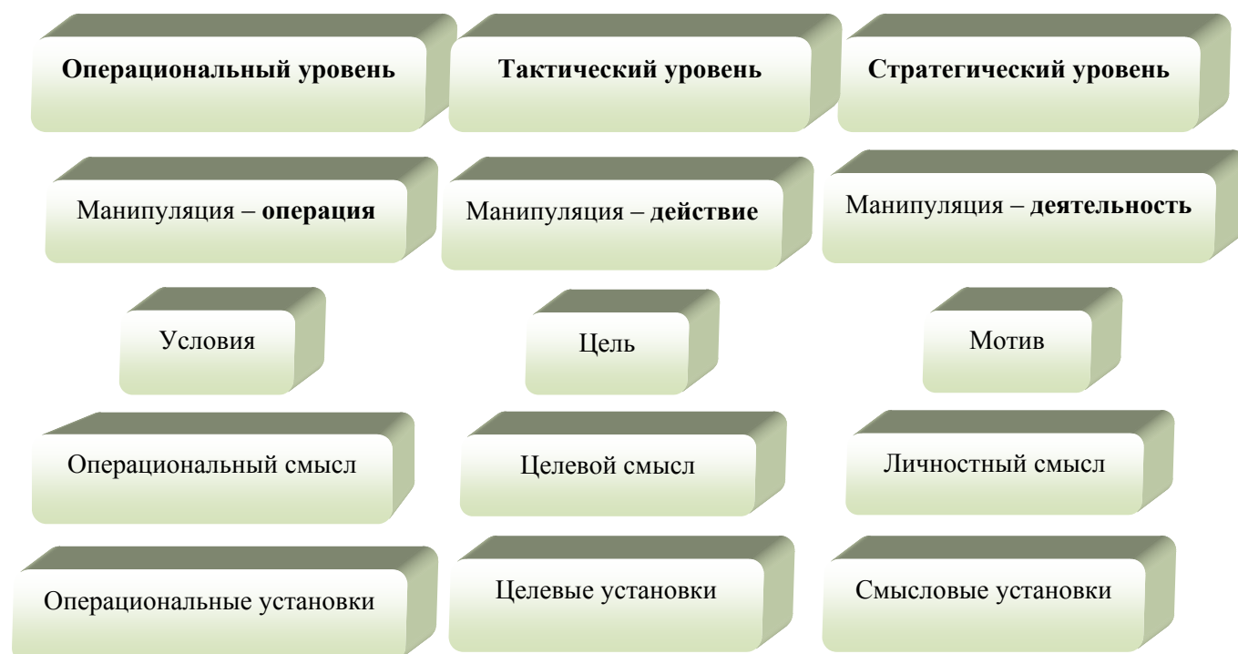
Рис. 1. Уровни манипулирования

На основании структурно-уровневого анализа деятельности (А.Н. Леонтьев, Д.Н. Узнадзе, А.Г. Асмолов), в котором устанавливается ценностно-смысловой состав операций, действий и деятельности в целом, нами была предложена трехуровневая структура манипулирования (рис. 1.), позволяющая выделить и описать различные формы проявления манипуляции.