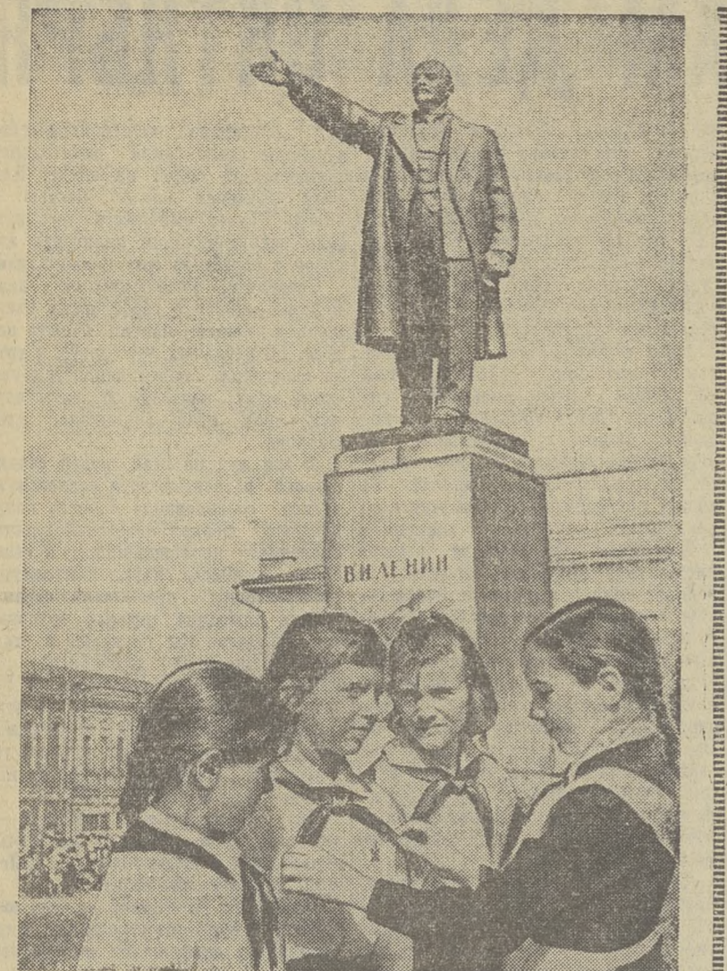
У юных томичей стало традицией: 22 апреля в день рождения великого вождя и учителя всех народов В. И. Ленина вступать в пионеры. Площадь Ленина. Десятки сотен воспитанников детских са- дов, октябрят, пионеры и комсомольцы побывали вчера здесь. В этот знаменательный день у подножия памятника великому Ленину около четырехсот октябрят стали пионерами. НА СНИМКЕ: прием в пионеры.

постоянным комиссиям Том- ского городского Совета депу- татов трудящихся. Ходатайства о присвоении звания «Почетный гражданин города Томска» рассмат- риваются исполнительным коми- тетом городского Совета, кото- рый вносит соответствующие предложения на обсуждение и утверждение Томского город- ского Совета депутатов трудя- щихся.