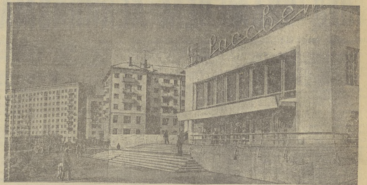
Растет и благоустраивается г. Ульяновск — ро- дина В. И. Ленина. За последние годы здесь созда- ны новые жилые кварталы. Особенно бурно идет строительство в Засвияжье — новом рабочем райо- не города. Недалеко время, когда Ульяновск прев- ратится в один из красивейших городов Поволжья. На снимке: кинотеатр «Рассвет» на набережной Волги.

выставка детского творчества, по- священного жизни и деятельности В. И. Ленина. Большой макет дома в улице Ленинской, где Владимир Ильич жил во время сибирской ссылки, макет броненосца, с которого он вы- ступал на филиппическом возгласе. Многочисленные детские рисунки, коллекции значков, марок, откры- ток на ленинские темы. Всего не перечесть. Особенно интересны макет броненосца, с которого он вы- ступал на филиппическом возгласе. После открытия этой замечатель- ной выставки началась конферен- ция. М. МИХАЙЛОВ.