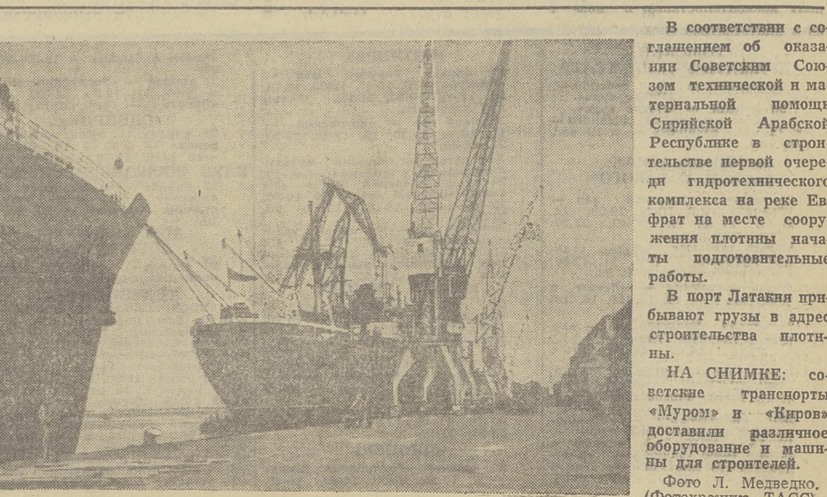
В соответствии с соглашением об оказании Советским Союзом технической и материальной помощи Сирийской Арабской Республике в строительстве первой очереди гидротехнического комплекса на реке Евфрат на месте сооружения плотных начаты подготовительные работы. В порт Лагана прибивают грузы в адрес строительства плотны. НА СНИМКЕ: советские транспорты «Муром» и «Киров» доставили различное оборудование и машины для строительства.

Присуждение Ленинских премий этого года свидетельствует о выдающихся достижениях нашего искусства и литературы. Они говорят о торжестве принципов единородности и партийности, о том, что в год славного юбилея Великой Октябрьской революции мастера советского искусства и литературы своими успехами достойно украшают всенародный праздник. (ТАСС).