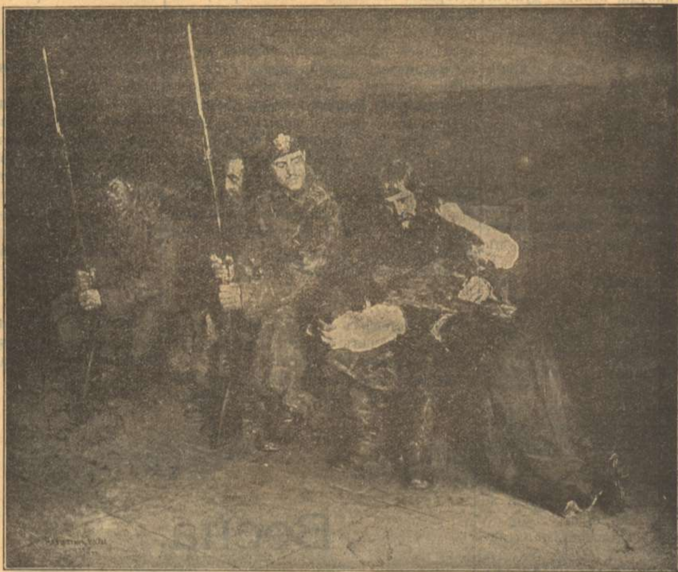
Въ ожиданіи суда. (Картина Касаткина).