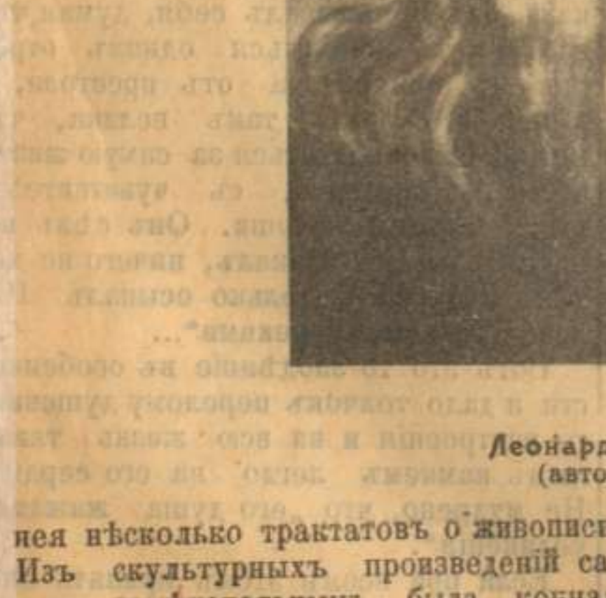
Леонардо да-Винчи (автопортрет).

леонардо трактовать о живописи. Изъ скульптурныхъ произведеній самыми замѣчательными была конная статуя Франческо Сфорца. Въ области архитектуры его проекты отличались необыкновенной смѣлостью. Напримеръ, проектъ поднятія древняго баптистерія С. Джованни во Флоренціи съ цѣлью повсѣлѣе фундаментъ, для того чтобы здание могло выдержать болѣе водостойчивый видъ.