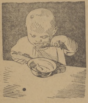
В деточаге за завтраком