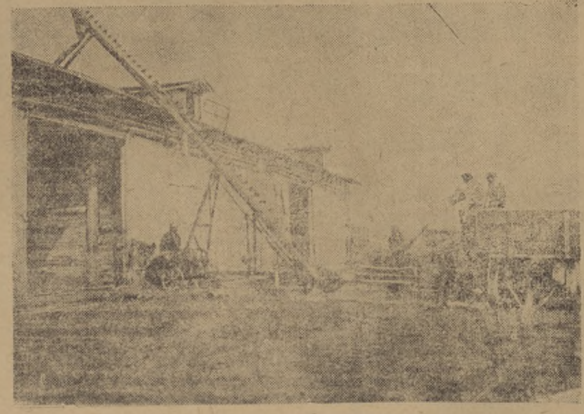
Механически зерно перегружается из машины в склад.