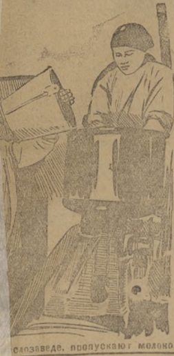
Слававеде, подпускают молоко.