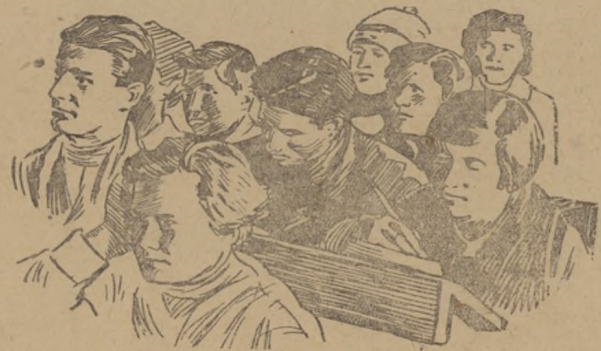
Слушатели кандидатской партшколы на занятии.