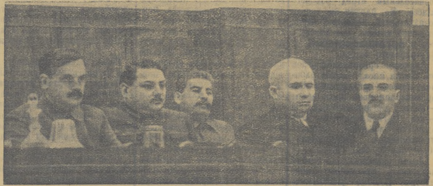
Товарищи А. А. Андреев, А. А. Жданов, Н. В. Сталин, Н. С. Хрущев и В. М. Молотов в президиуме конференции.