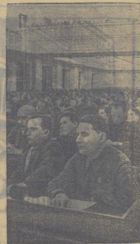
15 февраля в Большом зале Кремлевского дворца открылась XVIII Всесоюзная конференция ВКП(б). На снимке: в зале заседания.