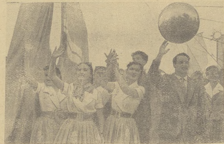
Вена. VII Всемирный фестиваль молодежи и студентов. Советская делегация на Венском стадионе.