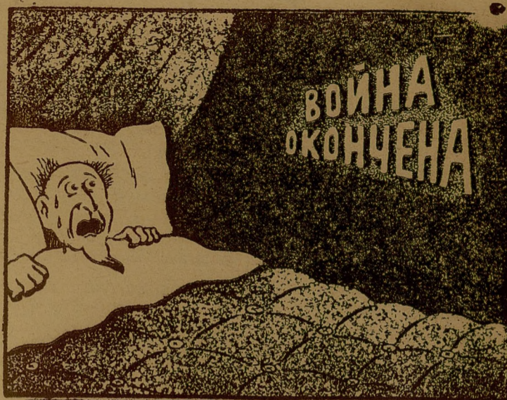
Страшное видение американского торговца оружием..

Капиталисты США заинтересованы в продолжении империалистической войны, приносящей им громадные доходы на военных поставках. (Из газет).