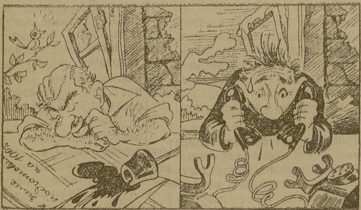
— Летом спячка.