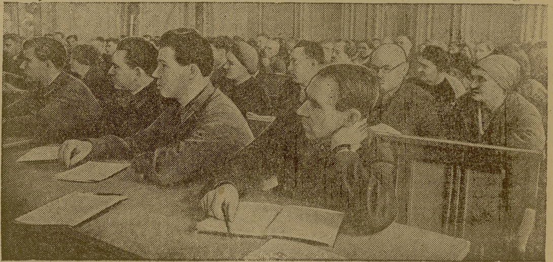
На лекции по истории ВКП(б).

В г. Горьком открылся воскресный университет, в котором учатся до 1000 рабочих и служащих предприятий г. Горького.