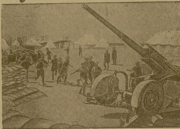
Тревога в английском военном лагере в Египте.

мании бросить на Англию сразу несколько тысяч танков, сыгравших решающую роль в быстрой победе над Францией. На страже этой 40-километровой водной преграды стоит могущественный английский военно-морской флот, продолжающий господствовать на море. Нельзя парализовать английский флот, не завоевав предварительно господства в воздухе, не подавив английскую авиацию, не разрушив аэродромы, не сломив английской противовоздушной обороны. Вот почему важнейшей особенностью нынешней англо-германской войны является борьба за господство в «английском воздухе». В этой борьбе Германия, естественно, направляет основной удар по Лондону, ибо в Лондоне сосредоточены десятки крупнейших военных, и в частности, авиационных заводов. Этот город является важнейшим транспортным узлом страны. Наконец,