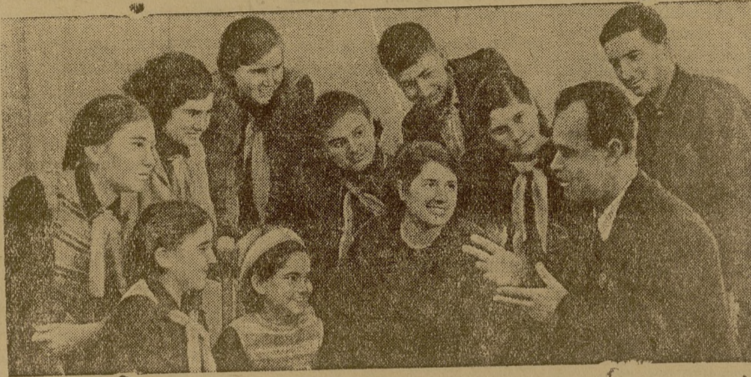
Дважды орденоседец—поэт Наира Зарян (справа) читает свои произведения молодым читателям.

Детская библиотека имени Хнко Апера в Ереване (Армянская ССР) имеет 30 тысяч книг на армянском, русском и азербайджанском языках. Библиотеку посещает около семи тысяч юных читателей. За 1940 г. выдано 126969 книг. Здесь часто устраиваются вечера—встречи с писателями, артистами.