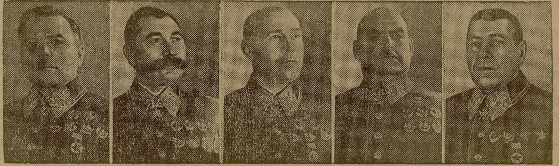
Маршал Советского Союза К. Е. Ворошилов. Маршал Советского Союза С. М. Буденный. Маршал Советского Союза С. К. Тимошенко. Маршал Советского Союза Г. И. Кулик. Маршал Советского Союза Б. М. Шапошников.

Да здравствуют Красная Армия и Красный Военно-Морской Флот! Да здравствуют красные воины, славные защитники нашего мирного труда, нашей великой родины!