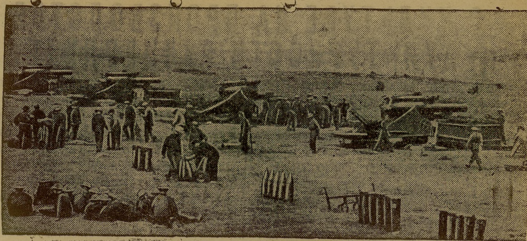
Война между Англией и Германией Артиллерийские укрепления на южном побережье Англии