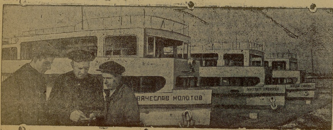
Перед выходом судов в плавание. (Дата с'емки—апрель 1941 г.)

В Хлебниковских судоремонтных мастерских пароходства канал Москва — Волга.