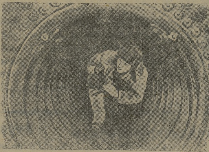
В освобожденном от немцев Новочеркасске.

Фашистские вандалы за время оккупации разрушили много лабораторий и цехов Новочеркасского индустриального института (Ростовская область). Коллектив студентов и профессорско-преподавательского состава усиленно работает над приведением в порядок институтских лабораторий и мастерских.